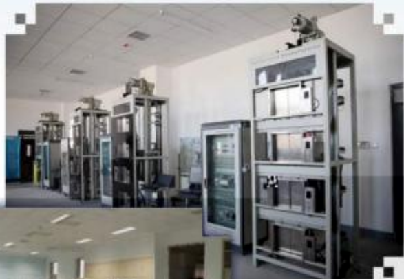
智能电梯安装调试 维护训练场所